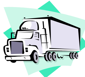
TRANSPORTADORA / OPERADOR LOGÍSTICO